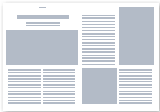
2/1 Seite PR B 420 x H 297 mm

Alle Preise exkl. 5% Werbeabgabe und 20% USt. AGBS siehe VN-Preisliste.